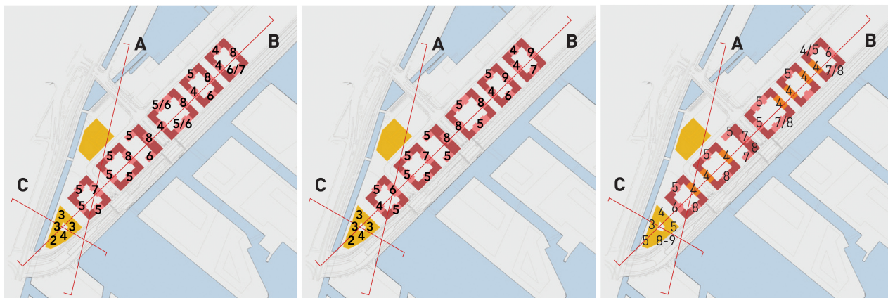
A Fællesrådets forslag til omfordeling af bygningshøjder

opfordre til en løsere struktur, så der opnås større variation bygningerne imellem, og vi vil appellere til, at der tænkes småerhverv ind.