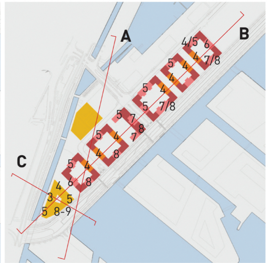
Til sammenligning nuværende scenarie A

Fællesrådets forslag til omfordeling af højderne vil give nogle væsentlige fordele i forhold til aftensolen, hvor folk er hjemme og for havneområdet. Forslagene rummer nogenlunde samme antal etagemeter. Hvis en teknisk beregning skulle vise sig at nå frem til noget andet, forholder vi os selvfølgelig konstruktivt til, hvor de sidste etagemeter skal placeres.