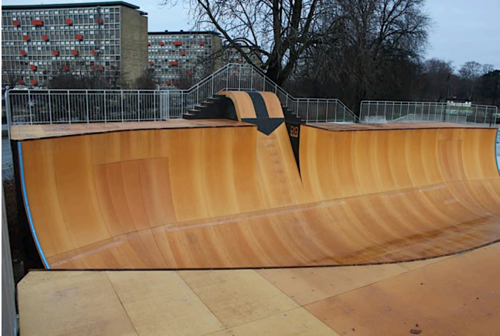
Billede 2 Vertrampen i Thyborøn