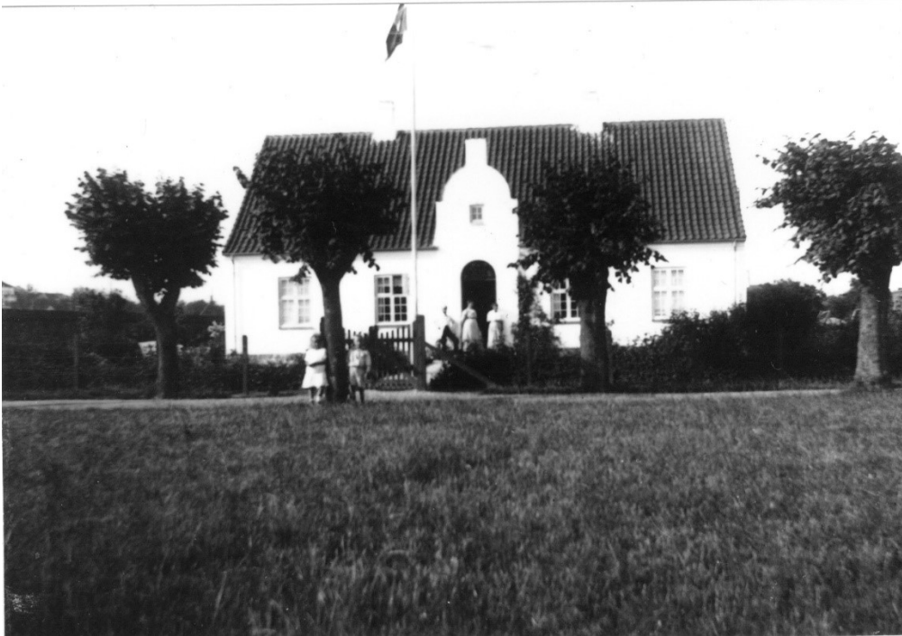
Figur 2 Strandhuset bygget i 1908. Stien foran er vejen ned til Jydske Asyls badehus. Årstal ukendt, Museum Ovartaci.

Administrationsarkivet for Helbredelsesanstalten for sindssyge eller Jydske Asyl 1846-1923. https://www.ovartaci.dk/administrationsarkivet-1846-1923 Hübertz, Jens Rasmussen: Om Daarevæsenets Indretning i Danmark, 1843. Selmer, Harald, Den Jydske Daareanstalt, 1852. Særskilt Aftryk af Bibliothek f. Læger XI Bd. 2 H, I. Trap Danmark, 1. udgave, 1858-60 og 2. udgave, 1872-79