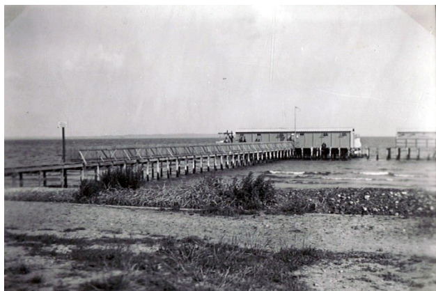
Figur 1 Badehuset ved stranden, år ukendt.

Området ved stranden har fra begyndelsen været af vital betydning for hospitalet og kilder viser endvidere, at området har været benyttet af patienter langt op i 1900-tallet.