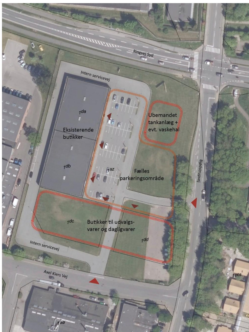
Udkast til fremtidig disponering med nye anvendelser

Rådgiver og udvikler står til rådighed for eventuelle spørgsmål og ser frem til en positiv behandling af ovenstående forslag.