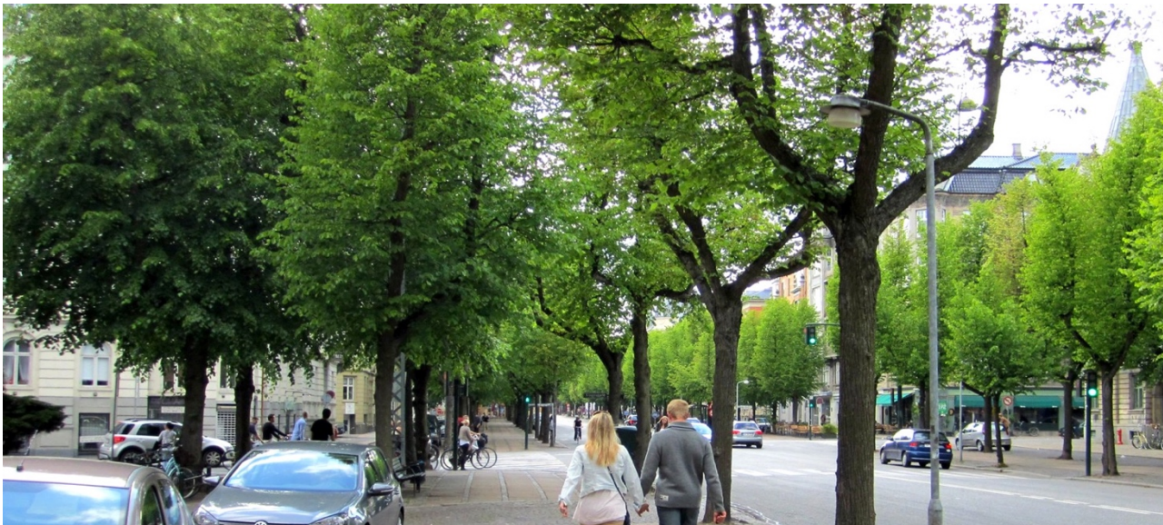
Illustration 1. Eksempel på en grøn allé. De smukke allétræer på Frederiksberg Allé gør gaden til en af de meste kendte i Danmark.