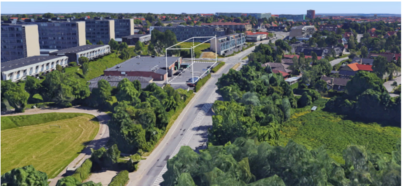
Illustration 3 Skitsen viser, hvor langt ud til vejen kommende byggeri skal ligge, hvilket vil fjerne helhedsindtrykket af en grøn allé. Det bliver 20 meter højt og får 5 etager. Måske skulle man snarere kalde det 6 etager, for der bliver anlagt taghaver med udsigt over Aarhus