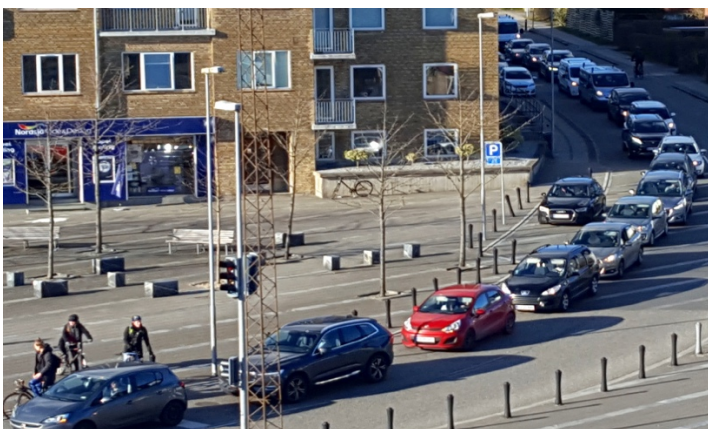
Illustration 2. Bilkø på Herredsvej ved Hasle Torv/krydset