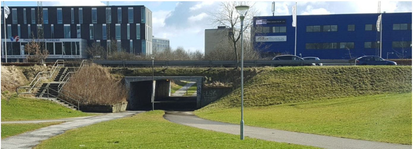
Illustration 4. Den nuværende viadukt under Ringvejen forbinder Bispehaven med det nye Ellekærkvarter. Viadukten giver områderne en tæt og tryk forbindelse, hvis den udvides og får elektrisk lys.