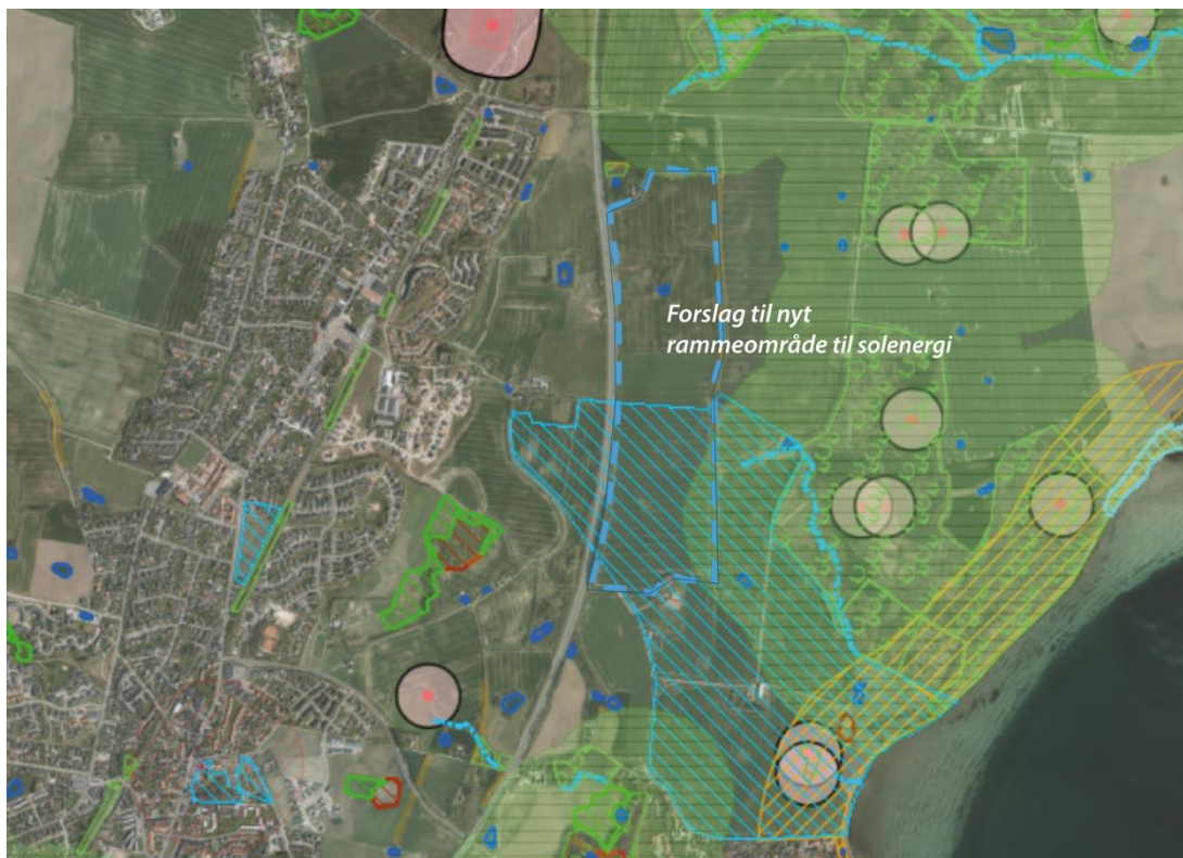
Oversigtskort der viser projektområdet, med markering af vores forslag til et nyt rammeområde til solenergi.

På baggrund af ovenstående foreslår vi området udpeget og arealet efterprøvet i en nærmere screening forud for en lokalplanlægning.