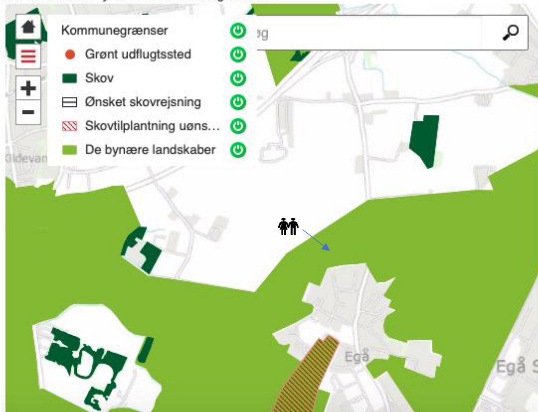
Kort nr. 2.5: De bynære landskaber og skovene